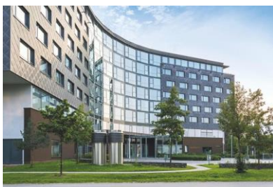
INFINITY Hotel &amp; Conference Resort

Der Munich Calibration Day findet am 13. und 14. September 2018 im INFINITY Hotel & Conference Resort Munich in Unterschleißheim statt. Nach den Fachvorträgen am ersten Tag, bekommen die Teilnehmer am zweiten Tag einen exklusiven Einblick in das esz-Labor in Eichenau. Beide Tage sind auch separat buchbar.